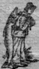
Always get the Emulsion with this mark—the Fishman—the mark of the "Scott" process.

ଏହା ତୁଳନା ପୁସ୍ତକ ପ୍ରଭୃତି ସମସ୍ତ ଲୋକଙ୍କୁ ଏକ ବାସ୍ତବ୍ୟ କରୁଛି ।